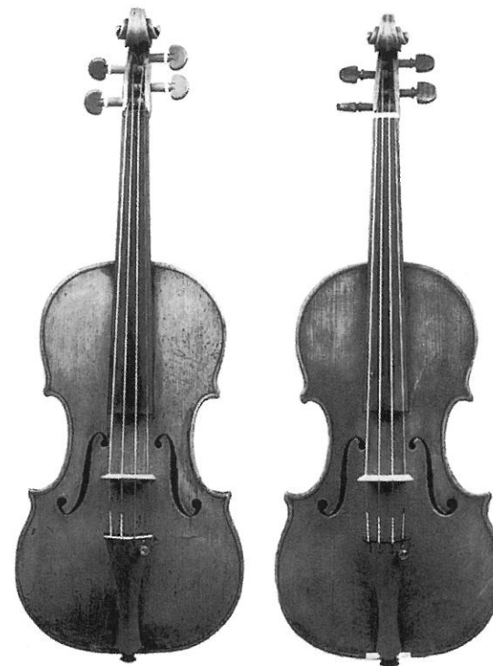
Giuseppe Guarneri del Gesù Giuseppe Antonio Rocca

シャコンヌでは、楽器をはじめケースや部品 等を直輸入し、当社の優れた技術で修復、調 整の上御紹介しております。また、これらす べての商品に大変お求めやすい独自のシャコ ンヌ・プライスを設定しております。 高額の楽器、弓に対しては可能な限りの責任 を意味する当社の鑑定書を発行し、買取り下 取りを保証しています。